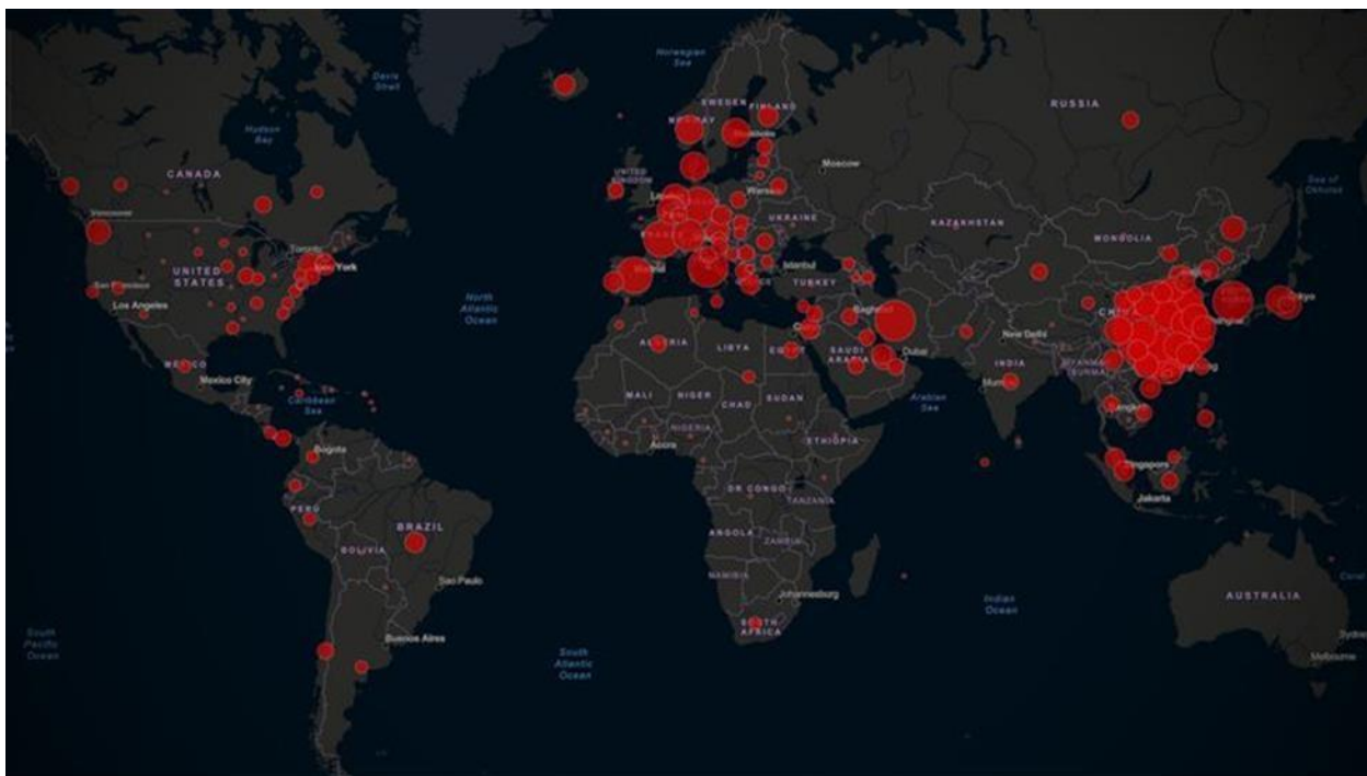
FIGURA 1 -Países, territórios e áreas com casos confirmados do COVID-19. OMS, 16 de Março 2020.