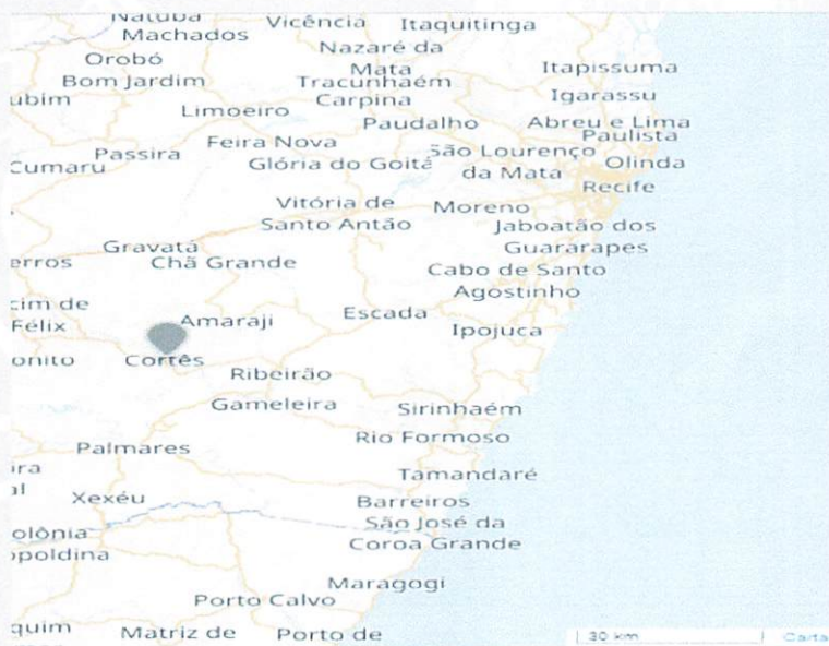
Localização de Cortês em Pernambuco

Franciely D. de Almeida Engenheira Civil CREA-PE 181957666-3