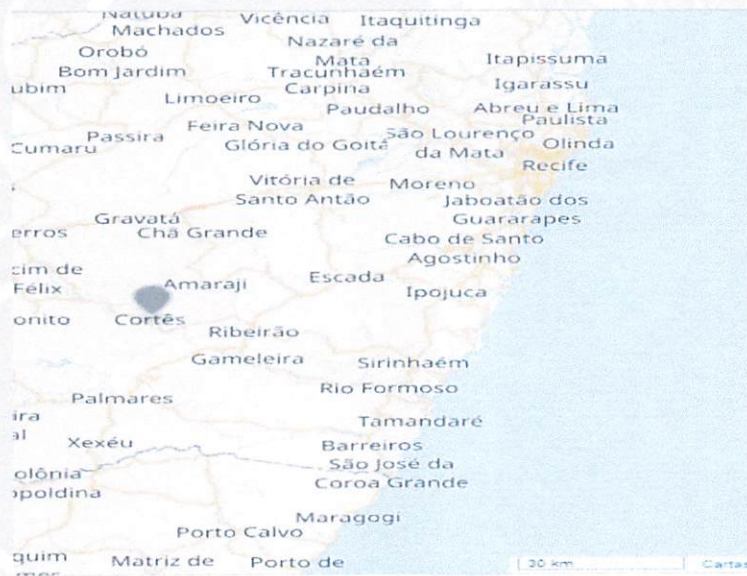
Localização de Cortês em Pernambuco