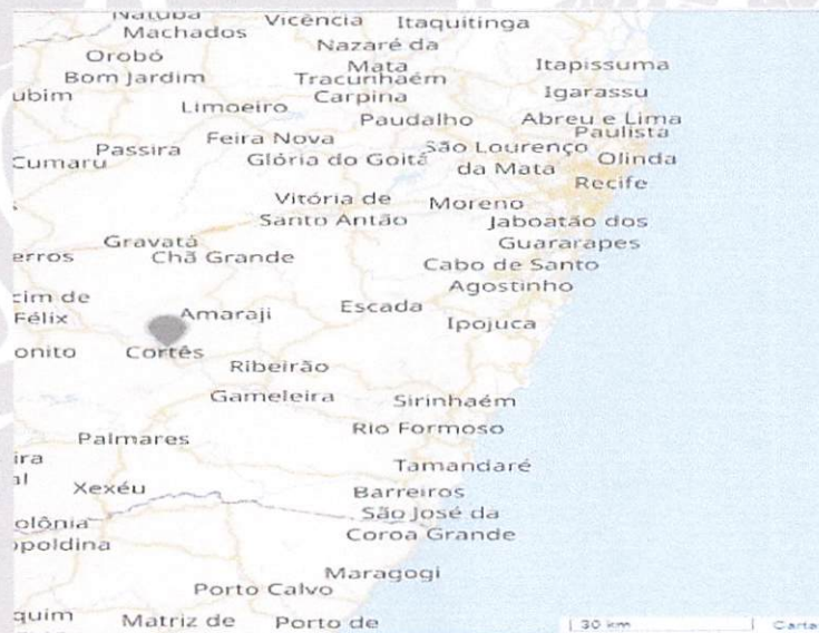
Localização de Cortês em Pernambuco