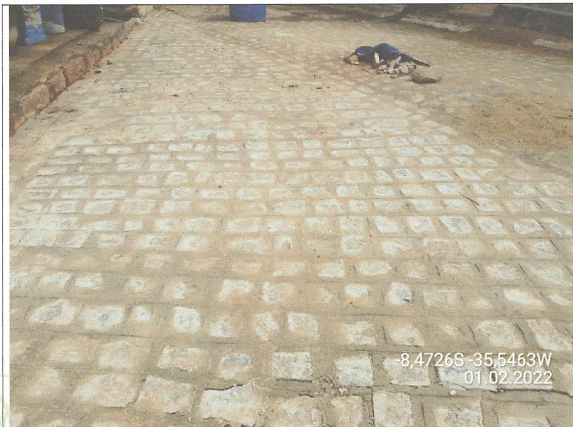
Construção do pavimento novo

serviços executados o longo dos trechos foram: